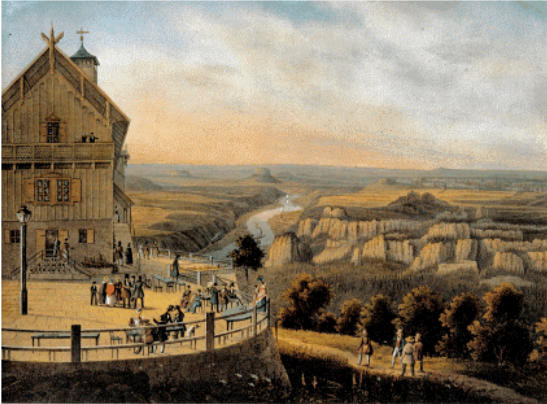
Der Große Winterberg mit Blick elbabwärts um 1850

Flammen züngelten auch zu den Wipfeln der harzigen Baumriesen empor. Das Prebischtor, der bewunderungswürdige, riesige Felsenaltar, war jetzt von knisternden und prasselnden Flammen umloht. Das Moos der Prebischtorfelsen brannte und die Feuerzungen leckten an der Holzbrüstung, welche die Prebischtordecke einfaßt. Das zwischen zwei kulissenartig vortretenden Felswänden so malerisch erbaute Gasthaus, das dem Bergfreunde einen angenehmen Aufenthalt gewährt, kam jetzt in die größte Gefahr.